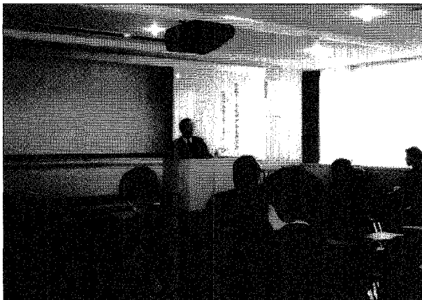
講演の様子（大阪会場）

車いす部門は、「車いす等の規格の現状と技研の対応（ビデオ上映）」と題し、平成12年度の車いす関連の事業結果を報告するとともに、ISO、SG等規格の現状と、研究所移転に伴う設備、体制について紹介しました。