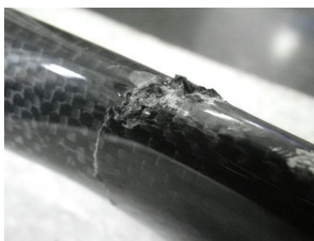
穴 あ き (例)