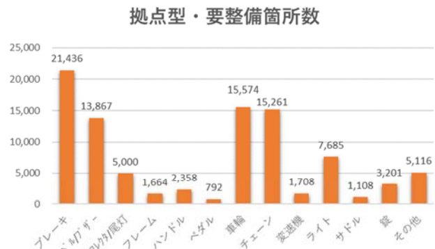
拠点型・総点検台数における要整備箇所の割合